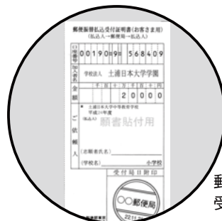
郵便振替払込受付証明書

郵便振替払込受付証明書を貼ってください。郵便振替にて納入後、「郵便振替払込受付証明書」を指定の位置に貼ってください。